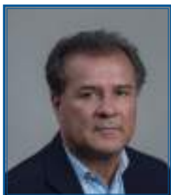
Artículo de Mario Fernández, PREVENTEC

Según la Estrategia Internacional para la Reducción de Desastres, las amenazas tecnológicas son aquellas originadas por incidentes tecnológicos o industriales, procedimientos peligrosos, fallos de infraestructura o de ciertas actividades humanas, que pueden causar muerte o lesiones, daños materiales, interrupción de la actividad social y económica o degradación ambiental.